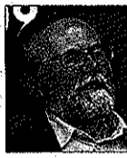
Prof. nadzw. dr hab. Ryszard Bugaj