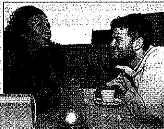
Zaproszenie na romantyczną kolację lub obiad.