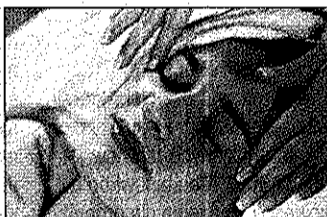
Karnet na ekskluzywne zabiegi w salonach kosmetycznych.

dziesięć biletów do kina, markowe długopisy, zestawy luksusowych kosmetyków i kosze ze słodyczami. Spośród osób głoszących na „Super Wykładowcę” rozlosujemy dwa zaproszenia do restauracji, karty na ekskluzywne zabiegi w salonach kosmetycznych, bilety do kina, wejściówki do dyskotek i dwa zaproszenia do SPA.